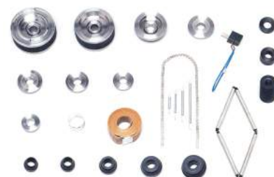
A3947T_014_1 - ערכת מתאמים לרכב פרטי