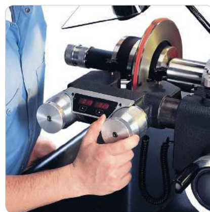
A3937T_005_4 - מדיד דיגיטלי